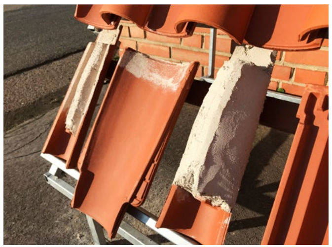
Pohled na bílou barvu malty po vyzrání.