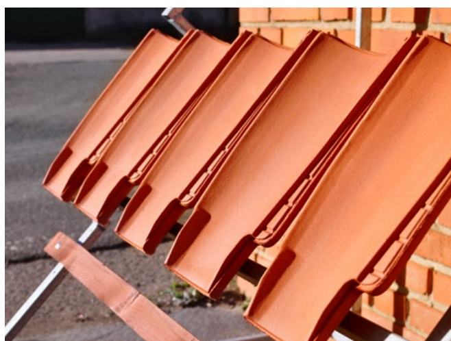
Příprava zkoušky – háky.