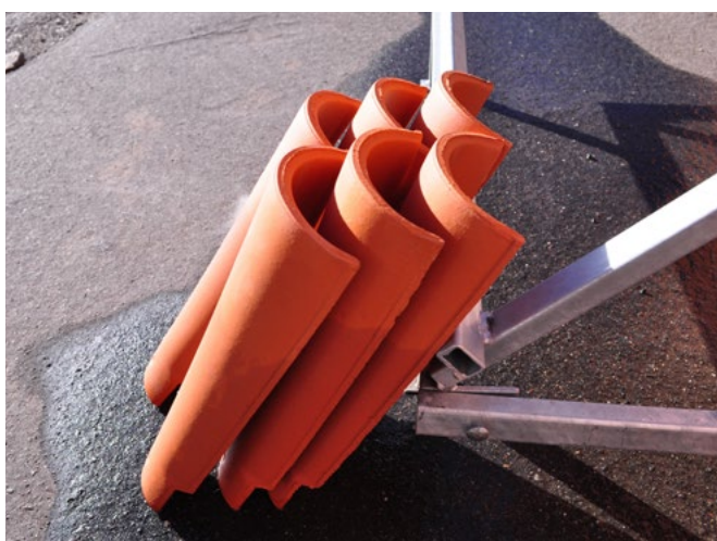
Příprava zkoušky – kůrky.