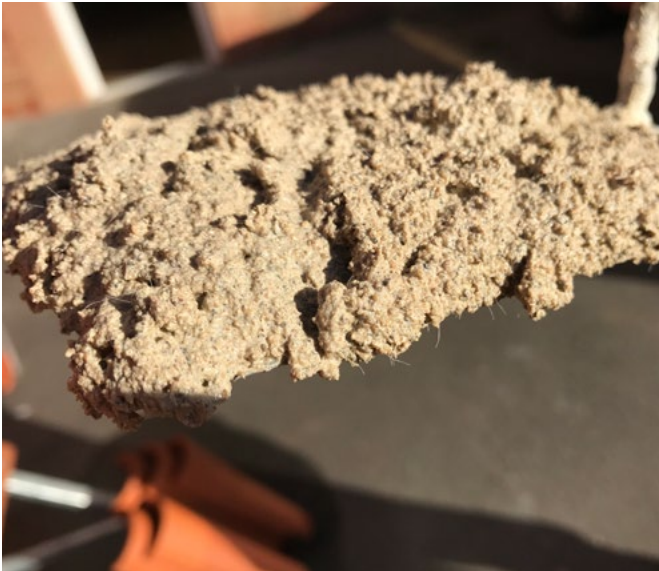
Po namíchání má malta béžovou barvu. Pohled na viditelná vlákna.