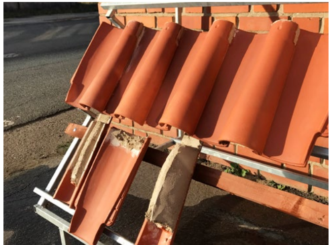
Pohled na dokončenou prejzovou krytinu loženou zcela do malty.