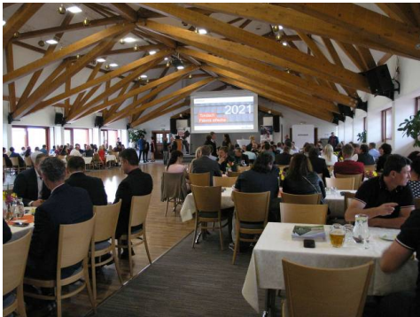
Atmosféra v sále