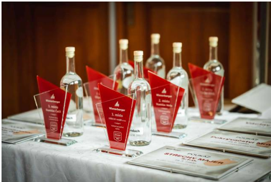
Trofeje pro vítěze