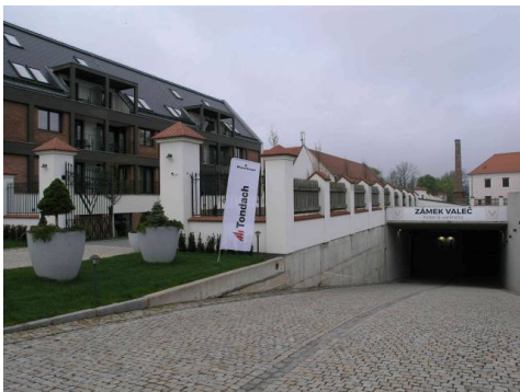
Zámek Valeč vítá účastníky slavnostního vyhlášení výsledků