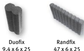
Duofix 9,4 x 6 x 25