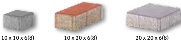
10 x 10 x 6(8)