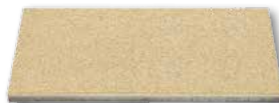
80,5 x 40,5 x 4,2