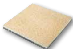
40,5 x 40,5 x 3,8 40,5 x 40,5 x 4,2