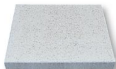
40 x 40 x 5; 50 x 50 x 5