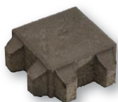
20 x 20 x 8