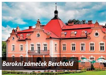
Barokní zámek Berchtold

Necelých 20 km od Jirčan na jedné z hlavních cyklotras se nachází zámek Berchtold. Jde o zrekonstruovaný historický objekt, ve kterém je dnes hotel, skvělá restaurace, wellness a sportcentrum. V zahradě je stálá výstava miniatur českých hradů, během roku se v zámecké zahradě nebo