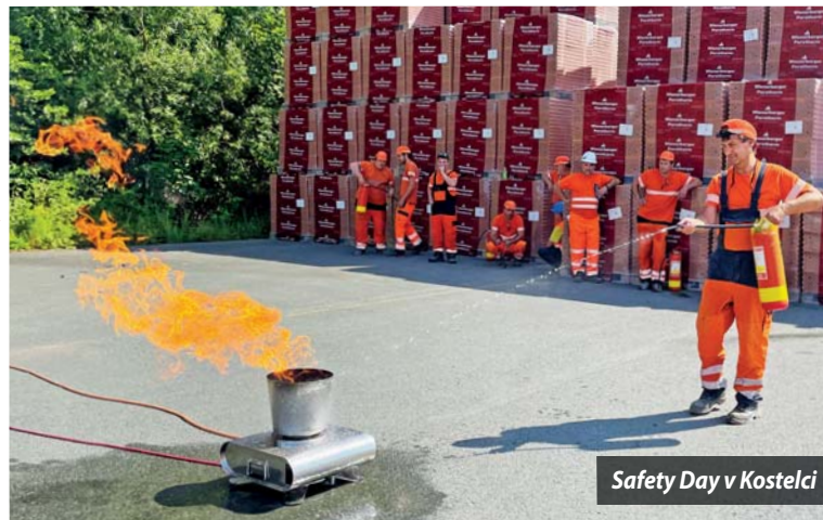
Safety Day v Kostelci

Už jste někdy drželi v ruce opravdový hasicí přístroj? Zvládli byste uhasit požár odpadkového koše? A jaké to je,