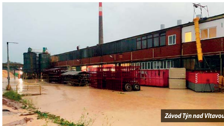
Závod Týn nad Vltavou

Ve středu 29. 6. 2022 večer se Vltavotýnskem prohnala silná bouře doprovázená přívalem lijáka. V centru města způsobila značné škody, které byly ihned zaznamenány sdělovacími prostředky. Všichni zaměstnanci proto přicházeli na čtvrtěční ranní směnu s napětím