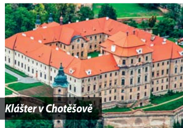
Klášter v Chotěšově

Kousek od Stodu na Křížovém vrchu stojí malý poutní kostelík vystavěný v roce 1862. V roce 2004 došlo k rozsáhlé rekonstrukci a kostel i věž opět slouží svému účelu. Věž je vysoká 22 metrů a poskytuje rozhled všemi směry – především na města Chotěšov a Stod a pohorí Český les. V Chotěšově se nachází barokní klášter premonstrátek ze 13. století, který se majestátně tyčí nad řekou Radbuzou a patří k nejstarším památkám na Plzeňsku. V jeho