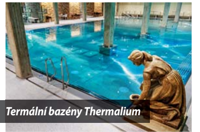
Termální bazény Thermalium

Teplíce jsou lázeňské město, dokonce jsou to naše nejstarší lázně a patří i k nejstarším lázním v Evropě. Kolegy bych pozvala do Thermalia v lázeňském domě Beethoven, jde o komplex největších a nejteplejších bazénů s čisté termální vodou z Čechách. Bazény jsou naplněny vodou z termálního pramene Pravdídlo. A mým druhým tipem je výlet na jeden z vrcholů Krušných hor – na Komáří vížku, kam vede víc než dva kilometry dlouhá dvousedáčková