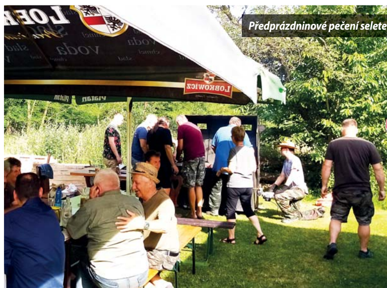
Předprázdninové pečení selete