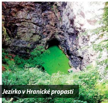
Jezírko v Hranické propasti

Pouhých pět kilometrů od našeho závodu se nachází nejhlubší propast České republiky – Hranická propast, která se pyšní i titulem nejhlubší zatope-