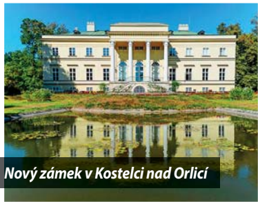
Nový zámek v Kostelci nad Orlicí

Návštěvníky kostelecké Cihelny Kinský určitě nejdřív pozveme na Nový zámek přímo u nás v Kostelci nad Orlicí. Když budete mít štěstí, může se stát, že vás zámeckou expozicí provede majitel zámku František Kinský. K zámku patří i velký anglický park, který přímo vybízí