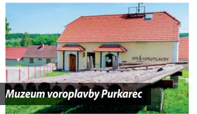
Muzeum voroplavby Purkarec