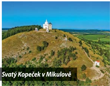
Svatý Kopeček v Mikulově

Mé doporučení na výlet pro kolegy by byl určitě výstup na Svatý Kopeček v Mikulově, což je 12 km od Novosedel. Dále pak procházka po Pálavě s mož-