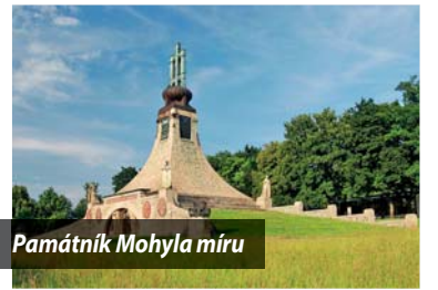
Památník Mohyla míru

nalezištěm doby stěhování národů. A za dálnicí D1 je kopec Santon, jehož