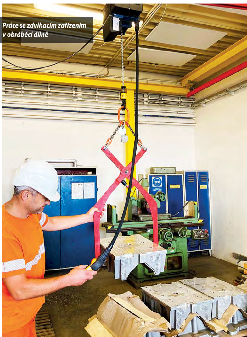
Práce se zdvihacím zařízením v obráběcí dílně