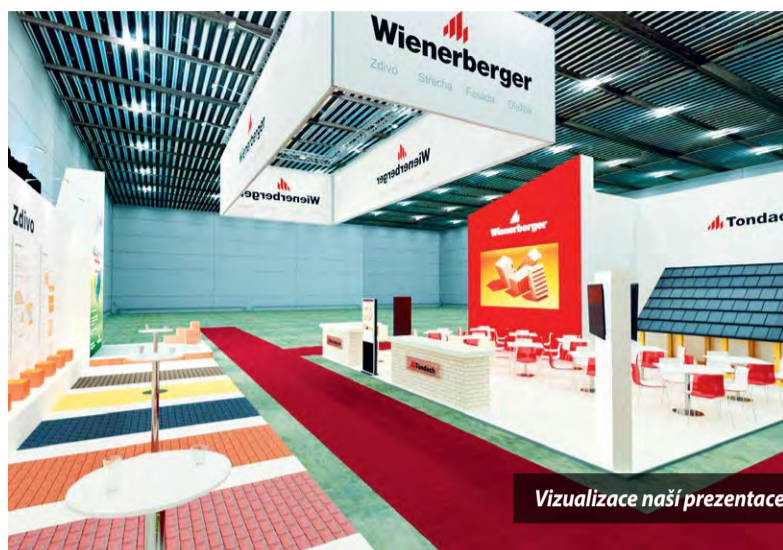
Vizualizace naší prezentace

Po dvou letech jsme si letos opět užili plnohodnotnou verzi stavebního veletrhu FOR ARCH, který se konal od 20. do 24. září 2022.