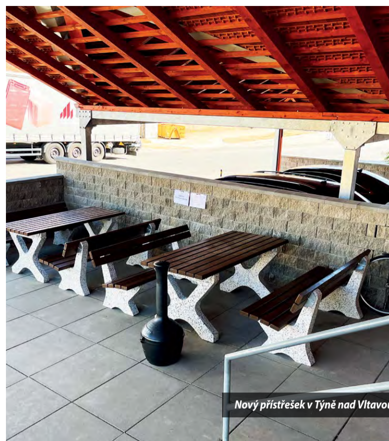
Nový přístřešek v Týně nad Vltavou