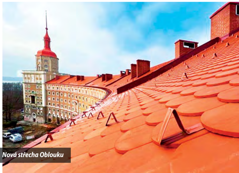
Nová střecha Oblouku

Majestátní budova zvaná Oblouk v Ostravě-Porubě se po letech konečně dočkala obnovy střeš.