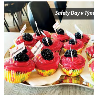
Safety Day v Týně

A právě o tom se následně mohli všichni přesvědčit při prohlídce závodu, během které opět proběhlo tzv. tagování, tedy označení potenciálně nebezpečných míst a všeho, co na závodě nefunguje na 100%. Následně proběhla školení o práci ve výškách, o bezpečném provozu vysokozdvíhových vozíků a o požární bezpečnosti s možností prakticky si vyzkoušet hašení požáru odpadkového koše.