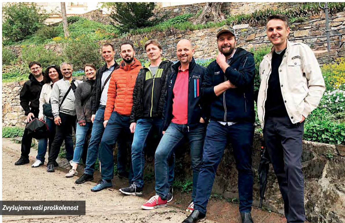
Zvyšujeme vaši proškolenost

Během letošního 1. pololetí jsme strávili na nejrůznějších formách školení a tréninků 12 800 hodin. To představuje 12,6 hodiny na každého zaměstnance. Jedeme tedy dle plánu.