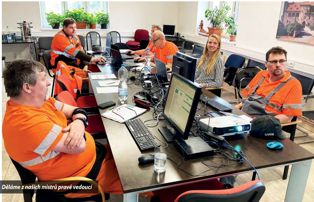
Děláme z našich mistrů pravé vedoucí

Abychom prohloubili a ujednotili znalosti, kterými oplývají naši mistři, a ukázali, že vše souvisí se vším, vznikla v závodě ve Stodu Akademie mistrů.