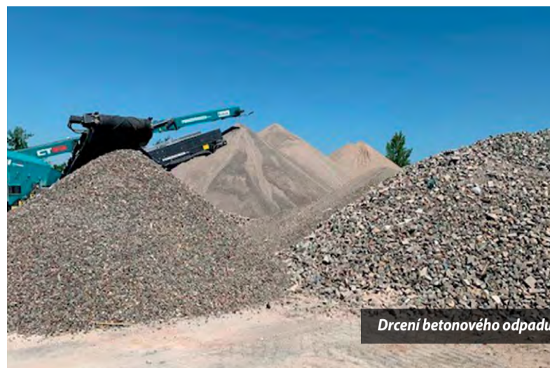
Drcení betonového odpadu

V závodě v Ledčicích probíhalo od poloviny července drcení betonového odpadu z výroby, který se tady nashromáždil za posledních několik let. A poprvé byla na tuto práci najata externí firma, která měla za úkol rozdrtit všechny betonový odpad na drť se zrnky o maximální velikosti 8 mm.