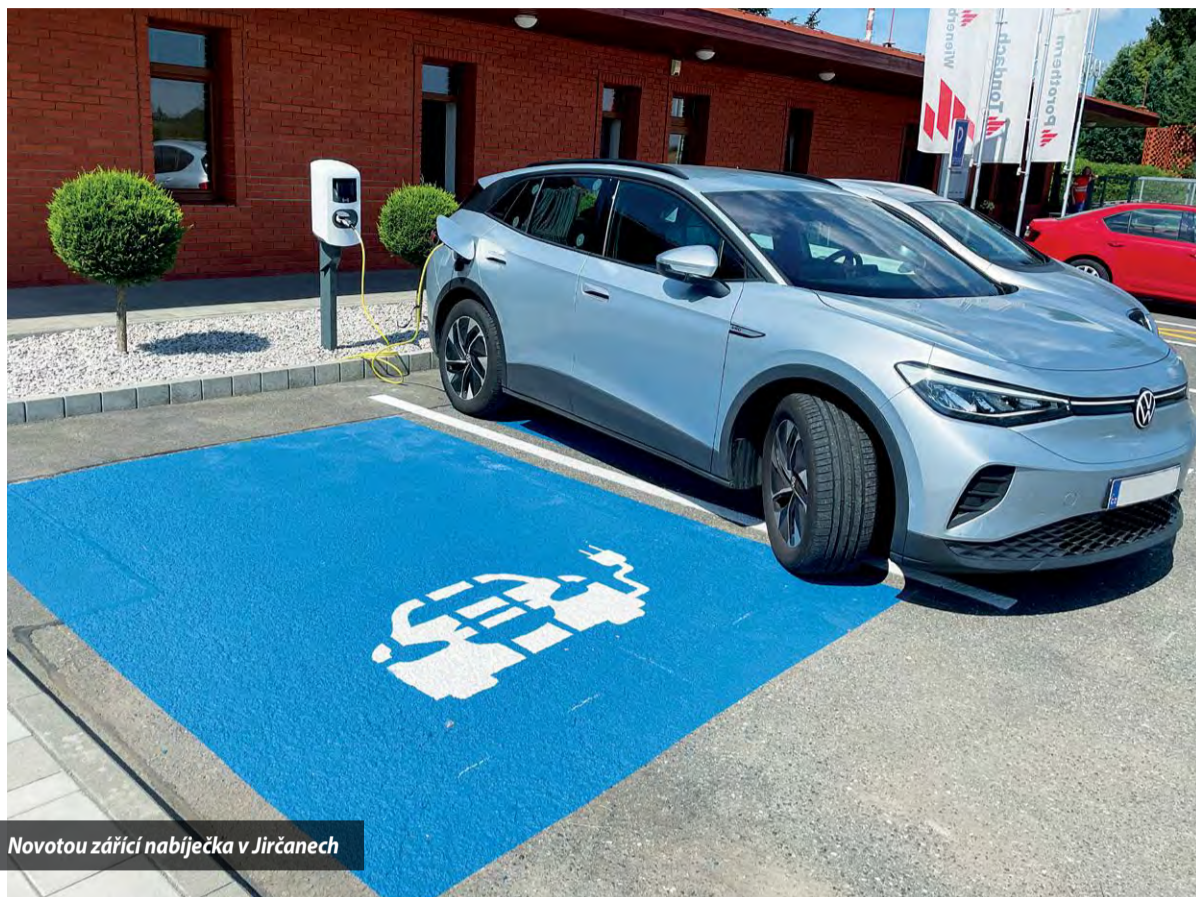
Novotou zářící nabíječka v Jirčanech

Dobíjecí stanice elektromobilů rostou ve Wienerbergeru jako houby po dešti. Aktuálně nabízíme ve třech lokalitách celkem 10 dobíjecích jednotek typu Eve Single Pro nebo Eve Duple o nabíjecím výkonu až 22 kW. Díky tomu se váš elektromobil dobije za 3 až 5 hodin.