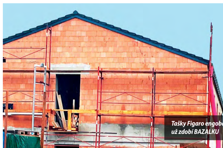
Tašky Figaro engoba už zdobí BAZALKU