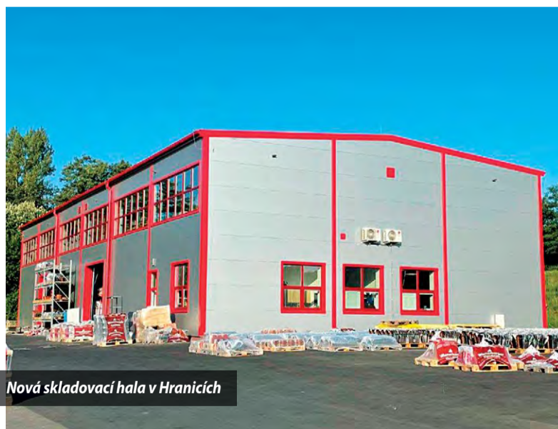
Nová skladovací hala v Hranicích

Naše očekávání od projektu Digitálního závodu (Digital Plant):