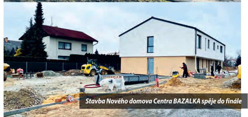
Stavba Nového domova Centra BAZALKA spěje do finále