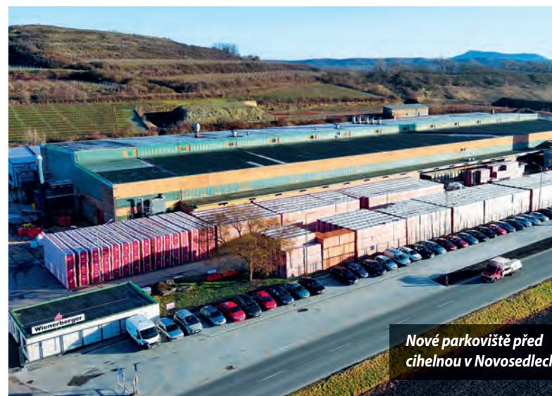
Nové parkoviště před cihelnou v Novosedlech