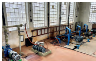
Vodárna v Jirčanech před (nahore) a po rekonstrukci (dole)

V průběhu let se Jirčany potácely víceméně na hraně existence. To se změnilo s příchodem Wienerbergeru. Získali jsme novou vizi a z Jirčan se stalo distribuční centrum krytiny, cihel, keramické dlažby a lícových cihel. Ze závodu v Čičenicích se k nám přesunula také výroba obkládacích pásků. Zde bych rád připomenul, že jsme začínali s roční produkcí 200 až 300 tisíc kusů pásků. Dnes už jedeme na dvě směny s plánovaným výkonem 1,2 milionu kusů ročně. Pokud se bavíme o Jirčanech, nemohu se nezmínit o lidech. Mám