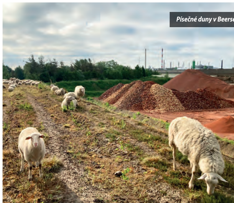
Písečné duny v Beerse