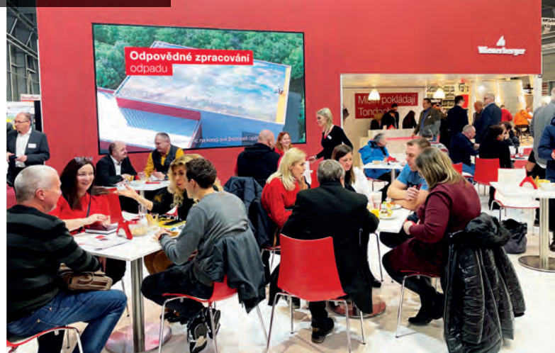
Náš stánek na veletrhu Střechy Praha