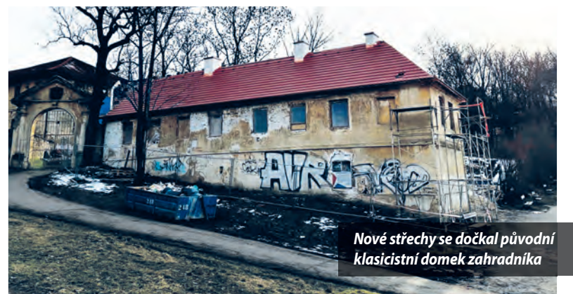
Nové střechy se dočkal původní klasicistní domek zahradníka