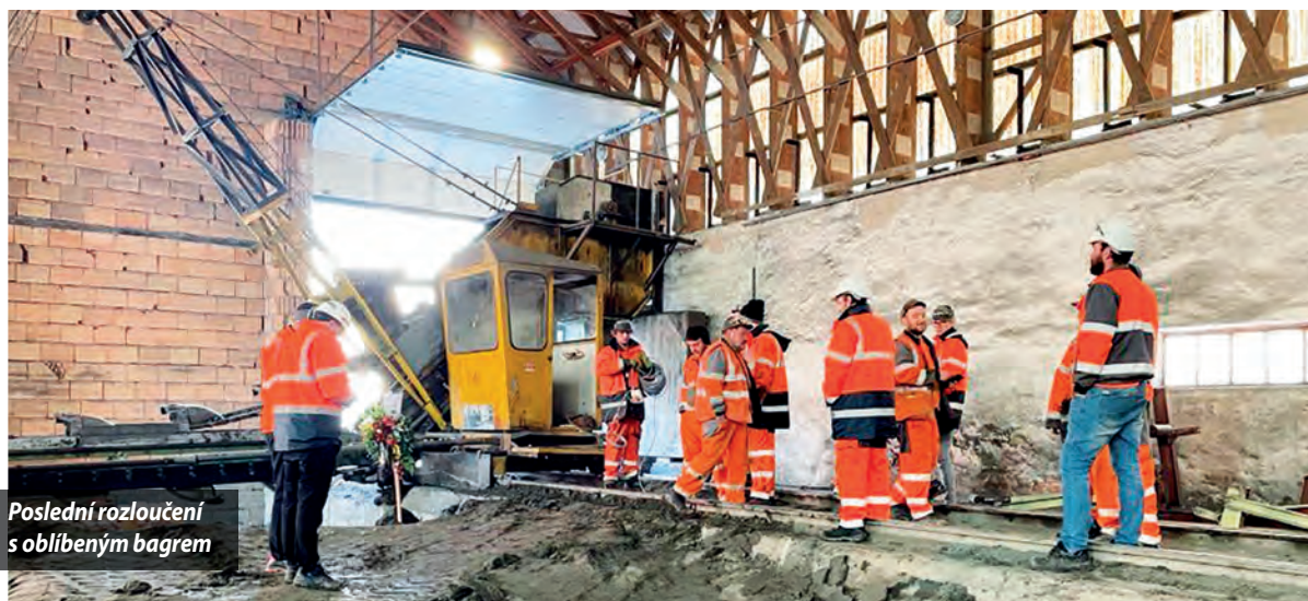
Poslední rozloučení s oblíbeným bagrem

Kolegové z cihelny v Holicích se v prosinci vtipně a s velkou slávou rozloučili s dlouholetým pomocníkem v závodě. Korečkové rypadlo RK25A se po 36 letech věrné služby odebralo na věčnost. Svou poslední službu