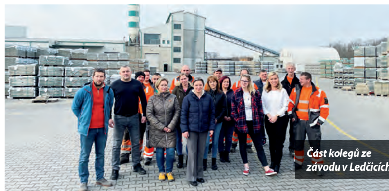
Část kolegů ze závodu v Ledčicích

Kroky k završení integrace společnosti Semmelrock do struktury Wienerbergeru jsou v plném proudu. Finále je tak na spadnutí!