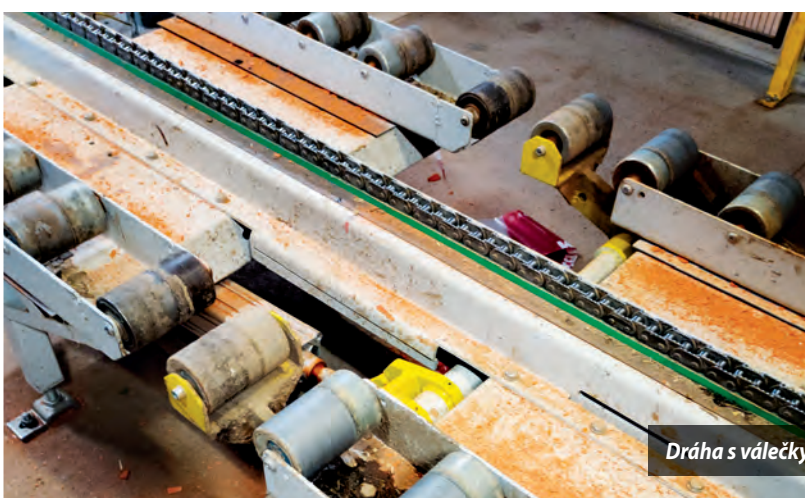
Dráha s válečky